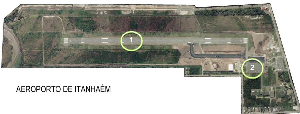
AEROPORTO DE ITANHAÉM